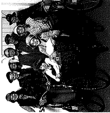
Stivol hoch zu Rad: 2. Tweed Run

Rennen. In London findet er seit Jahren statt und die 400 Startplätze sind immer innerhalb einer Stunde ausverkauft. Stivol in die Pedale treten wird aber auch in New York, Tokio oder in Oldenburg in Oldenburg. In Kiel verzeichnete der erste Tweed Run vor einem Jahr gut 100 Teilnehmer (darunter auch der damalige Oberbürgermeister Torsten Albig). Der Schwerpunkt der Zehn-Meilen-Fahrt in diesem Jahr liegt auf dem Ostufer. Am Ausgangspunkt, dem Volksbank Pavillon (Europaplatz), werden zwischen 100 und 150 Teilnehmer erwartet. Vom Start an geht es um Spaß, Originalität und ein Sich-Kennenlernen – weniger um Geschwindigkeit. Auch der Trainingsanzug aus den 70ern oder das Knickerbocker und das Rad aus den 1930ern. Nach Vergabe der Startnummern und der Roadmap – der Streckenbeschreibung – werden alle Teilnehmer fotografiert. Und dann geht es los durch Gaarden. Nach einer Brausepause am Gießereimuseum geht es über die Mole im Marine Arsenal. Um Notfälle auf der Strecke kümmert sich ein Flickservice. Am Ziel in der Dänischen Straße gibt es für die Teilnehmer Tee und Scones, und ein frisch gezapftes Guinness.